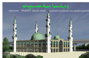
Ahle Sunnat wal Djama'at

Secretariaat Postbus 12904 1100 AX Amsterdam ☎: 020 - 6982526 Fax: 020 - 6953522 Afdeling Amsterdam Kraaiennest 125 1104 CH Amsterdam Afdeling Eindhoven Kastelenplein 169a 5653 LX Eindhoven ☎: 040 - 2513089 Afdeling Almere ☎: 06 21288268